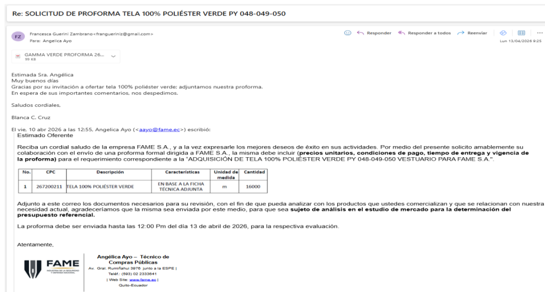
Captura 17: Solicitud de proforma

Las entidades contratantes procurarán obtener al menos tres proformas, las cuales podrán ser gestionadas a través de la herramienta de "Necesidades de contratación y recepción de proformas", mediante correo electrónico o cualquier otro medio: