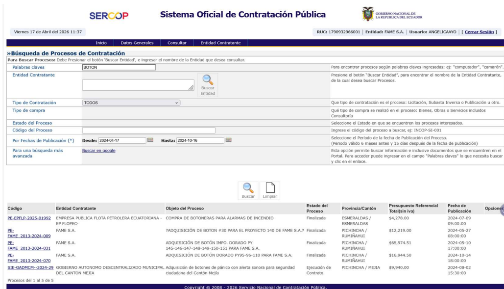
Captura 1: Resultado de búsqueda portal SOCE intervalo 1

Dentro del periodo se encontró varios procesos relacionados con la palabra clave al realizar el análisis de los mismos se evidenció que son diferentes tipos de botón, para otro tipo uso. Concluyendo que ningún proceso tiene exactamente el mismo bien. Se evidencia con las capturas de pantalla.