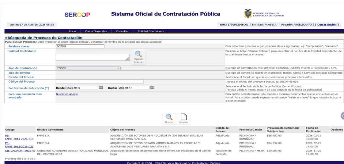
Captura 11: Resultado de búsqueda portal SOCE del intervalo 4

Dentro del periodo se encontró 3 procesos relacionados con la palabra clave al realizar el análisis de los mismos se evidenció que son diferentes tipos de botón, o para otro tipo uso. Concluyendo que existe 1 solo proceso que tiene exactamente el mismo bien. Se evidencia con las capturas de pantalla.