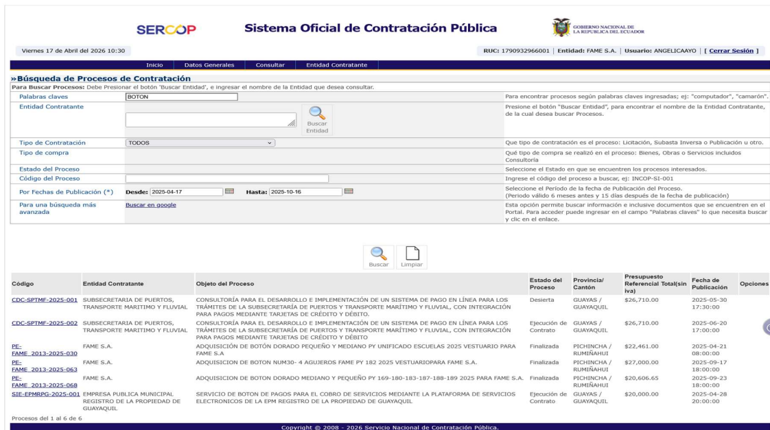
Captura 7: Resultado de búsqueda portal SOCE del intervalo 3

Dentro del periodo se encontró varios procesos relacionados con la palabra clave al realizar el análisis de los mismos se evidenció que son diferentes tipos de botón, de otro tipo uso o contratación de servicios. Concluyendo que existe 1 solo proceso que tiene exactamente el mismo bien. Se evidencia con captura de pantalla.