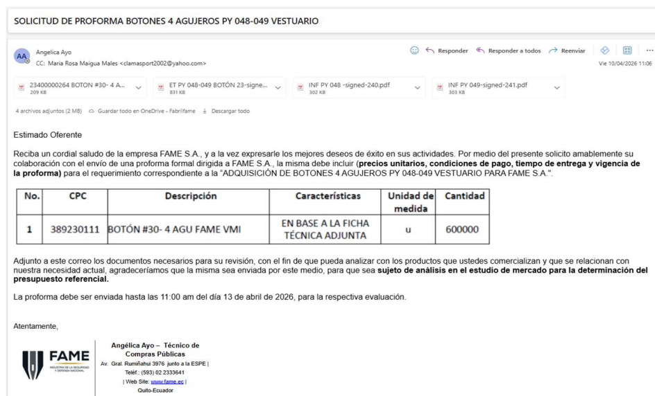
Captura 15: Solicitud de proforma

Las entidades contratantes procurarán obtener al menos tres proformas, las cuales podrán ser gestionadas a través de la herramienta de “Necesidades de contratación y recepción de proformas”, mediante correo electrónico o cualquier otro medio: