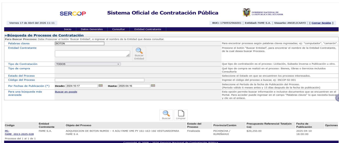
Captura 5: Resultado de búsqueda portal SOCE del intervalo 2