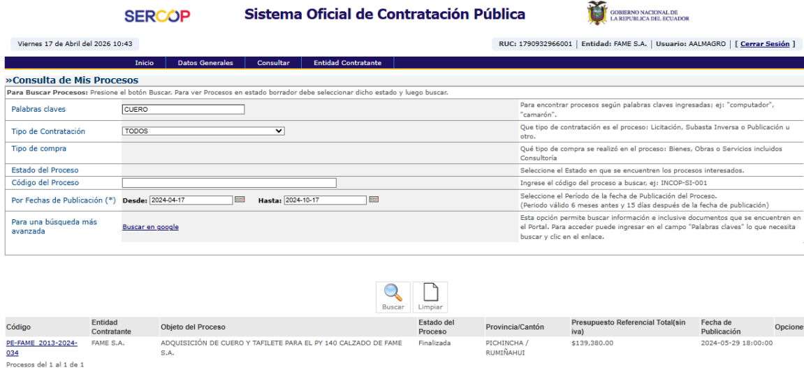
Captura portal SOCE 12: Resultado de búsqueda del intervalo 4 con "CUERO"

En este período se encontró un proceso que está relacionado con el objeto de la contratación. Se evidencia con las capturas de pantalla.