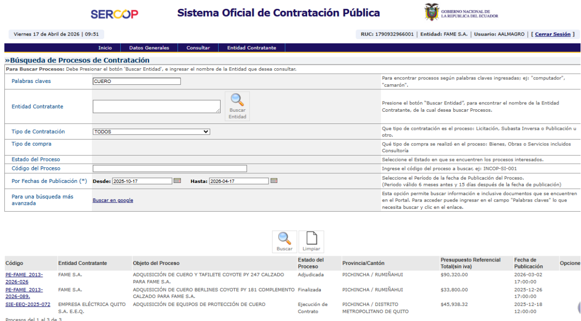
Captura portal SOCE 1: Resultado de búsqueda del intervalo 1 de búsqueda “CUERO”

Se adjuntan en el presente documento las capturas de pantalla de verificación realizadas en el Portal de Compras Públicas, correspondientes a procesos efectuados por distintas entidades (incluido FAME S.A.) en los últimos dos años mediante la búsqueda de las palabras clave: