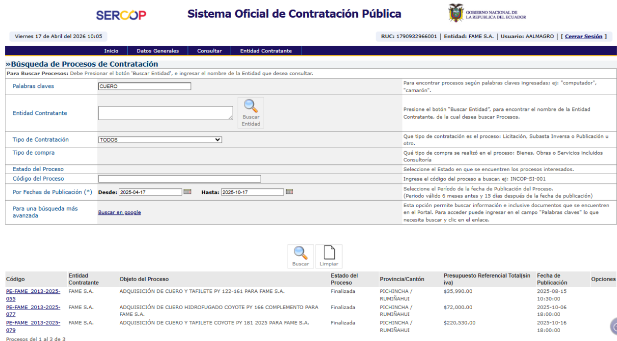
Captura portal SOCE 4: Resultado de búsqueda del intervalo 2 de búsqueda "CUERO"