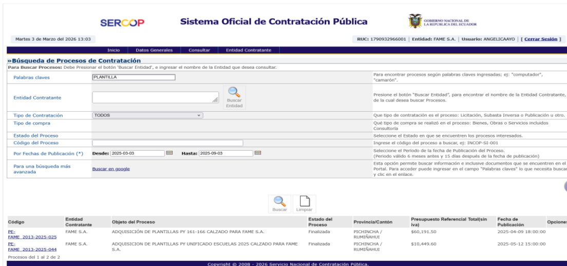
Captura 5: Resultado de búsqueda portal SOCE del intervalo 3