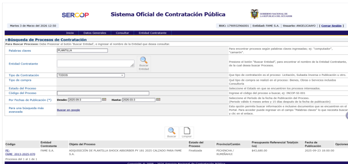
Captura 6: Resultado de búsqueda portal SOCE del intervalo 4