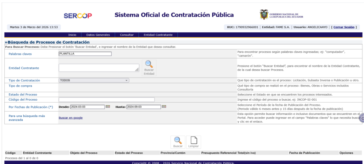
Captura 1: Resultado de búsqueda portal SOCE 2 del intervalo 1

En este periodo NO se encontró procesos relacionados con el objeto de contratación