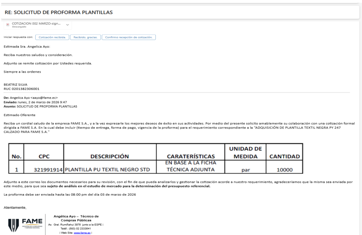
Captura 9: Solicitud de proforma

Las entidades contratantes procurarán obtener al menos tres proformas. A continuación, se presenta la constancia de la solicitud correspondiente: