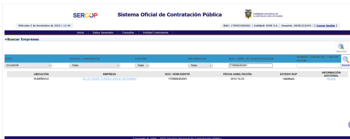
Captura 16 Verificación habilitado