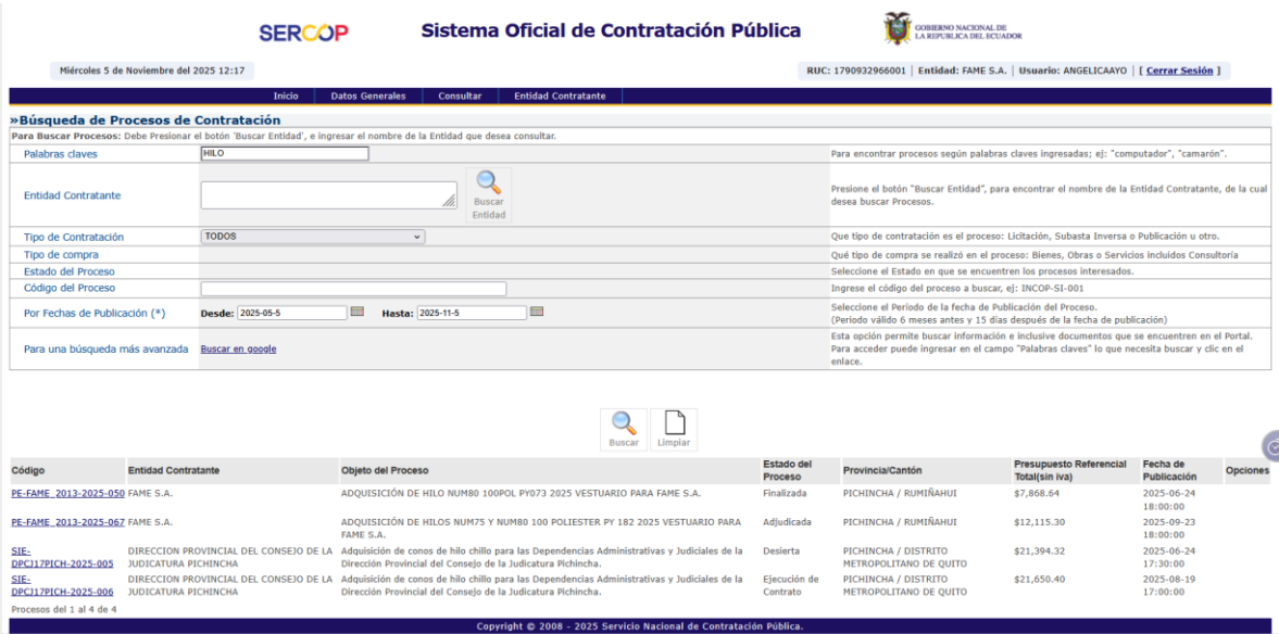
Captura 9: Revisión bienes PE-FAME_2013-2025-.107