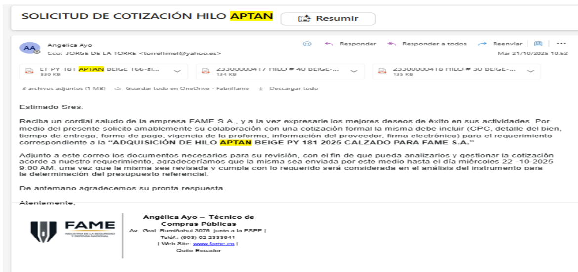
Captura 15: Solicitud cotización