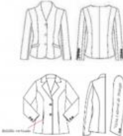
CHAQUETA CASIMIR PARA MUJER