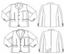
CHAQUETA CASIMIR PARA HOMBRE

Confección de Uniformes Institucionales (5)